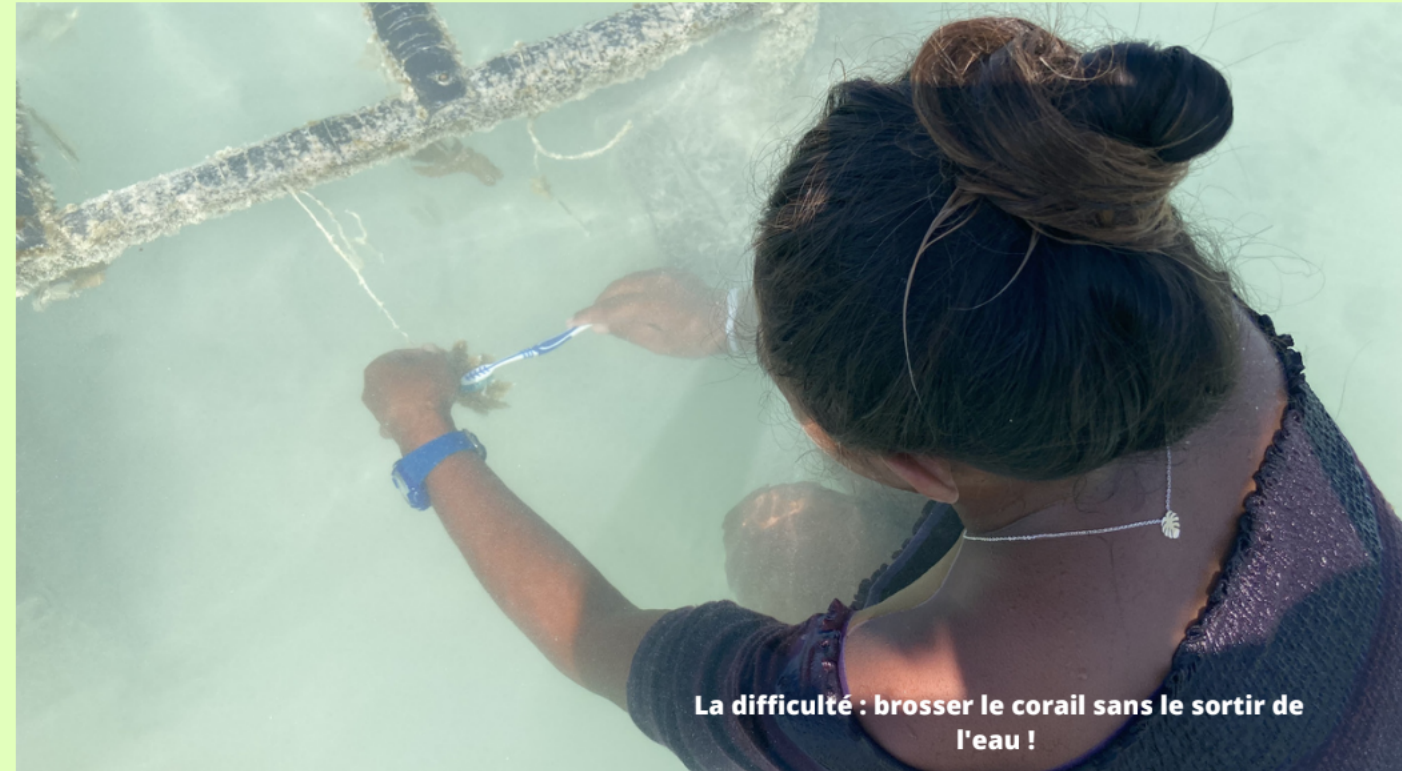
La difficulté : brosser le corail sans le sortir de l'eau !

Avec l'aide des stagiaires du RSMA, des structures en PVC ont été installées dans