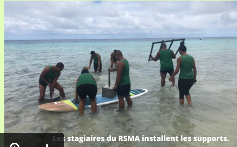
Les stagiaires du RSMA installent les supports.